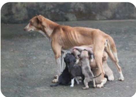
O resultado de reproduções ad hoc ...

Os métodos químicos, por administração de anticoncepcionais, são reversíveis, obrigam a administração periódica e têm alguns efeitos secundários.